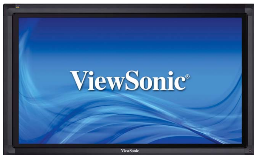
Tableau blanc intelligent au design tout-en-un, parfait pour les salles de classe et de réunion