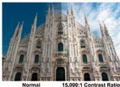
Normal 15,000:1 Contrast Ratio