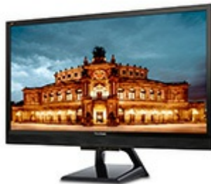
3000:1 Contrast Ratio