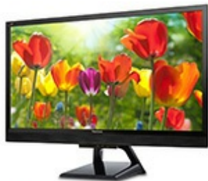
ViewSonic Flicker-Free Technology