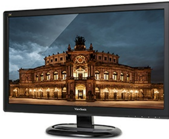
3000:1 Static Contrast Ratio