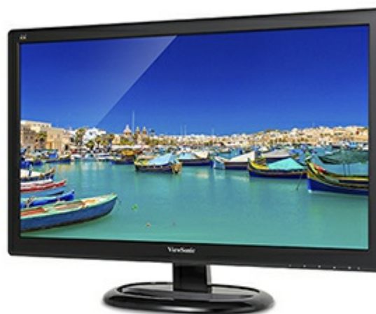
ViewSonic Flicker-Free Technology