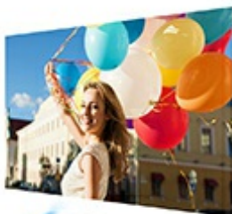
SuperColor™ projectors offer color accuracy levels