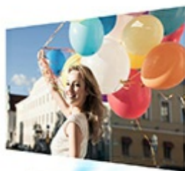
Conventional projectors offer low-quality images