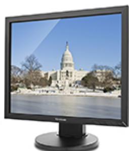
Dynamic Contrast Ratio