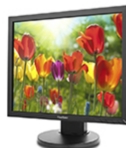
ViewSonic Flicker-Free Technology