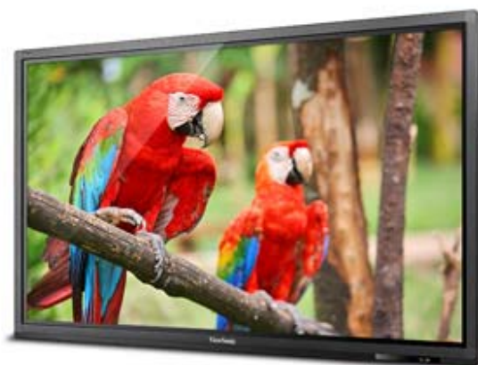
Full HD Resolution

Aktuelle Produktinformationen finden Sie auf unserer Webseite: www.viewsonic.de